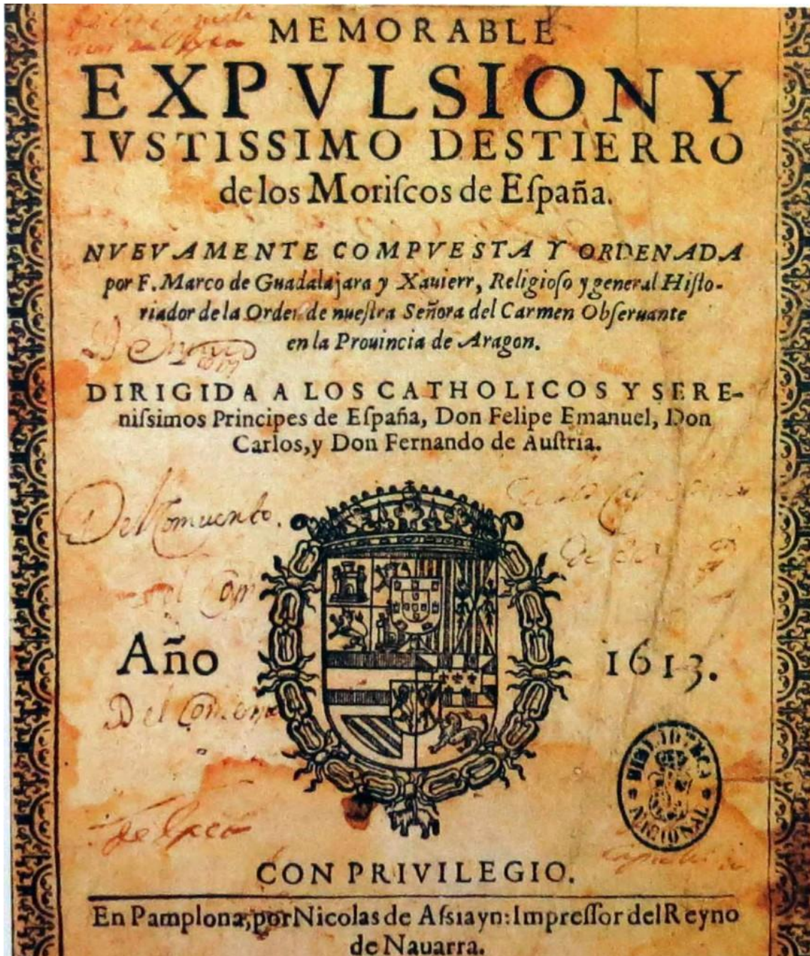
DECRETO DE EXPULSION 1613