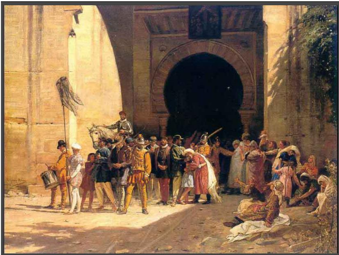
LA EXPULSION DE LOS MORISCOS